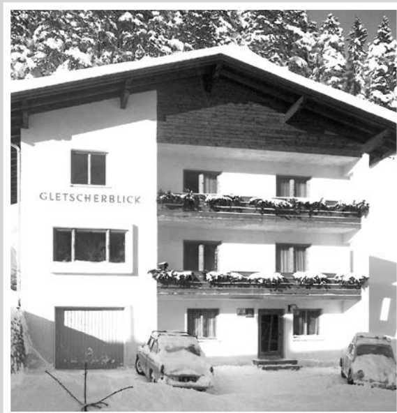
VON DER EINFACHEN PENSION ZUM 4-STERNE-SUPERIOR HOTEL