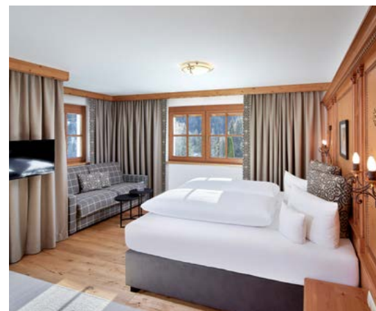
SCHLAFZIMMER – APPARTEMENT SCHMUCKKASTL

„ KEIN TRAUM, SONDERN ECHTES ERLEBNIS MIT BLICK IN DIE NATUR. “