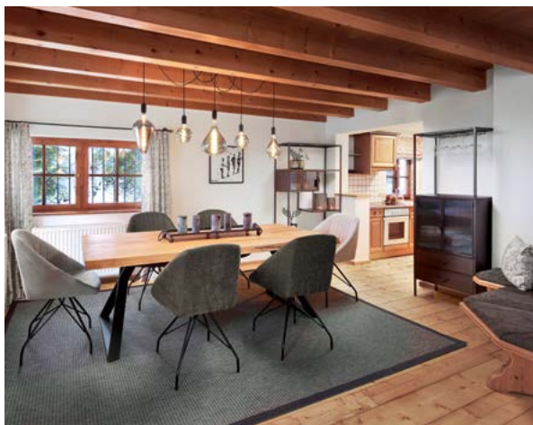
HIDE-AWAY FÜR INDIVIDUALISTEN – UNSER CHALET