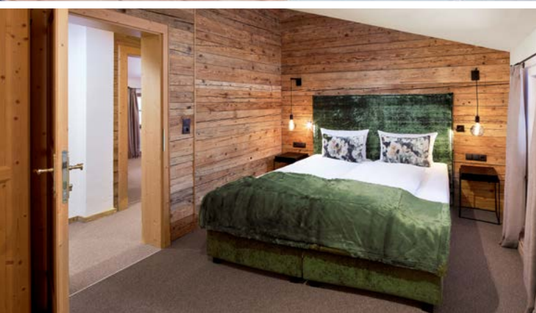
BOXSPRINGBETTEN FÜR ERHOLUNG PUR – SCHLAFZIMMER CHALET

vereinen Gemütlichkeit und gehobenen Stil. Viel Holz, Textilien in Naturtönen und ein traditioneller Kachelofen schaffen ein Landhaus-Feeling der modernen Art. Vor allem Familien und befreundete Paare schätzen die lässige Kombination von geselligen Gemeinschafts- und kuscheligen Rückzugsbereichen sowie den entspannten Tagesablauf. Die komplette Verwöhnpension wird im Hotel eingenommen und auch der Wellnessbereich steht unseren Landhausgästen natürlich offen.