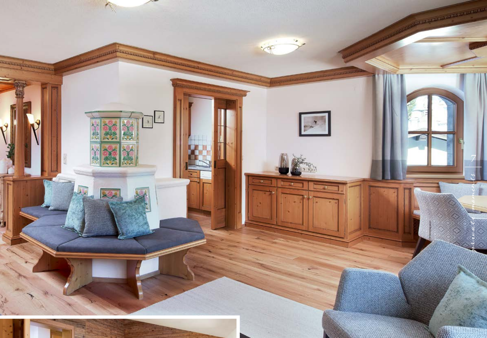
LANDHAUS-FEELING À LA GLETSCHERBLICK – APPARTEMENT SCHMUCKKASTL