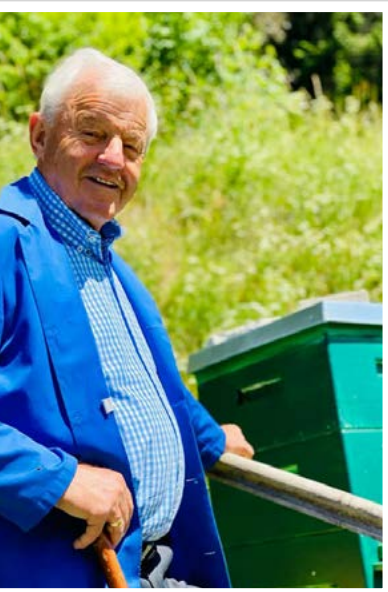
SEIN LIEBSTER AUSGLEICH WAR DIE IMKEREI.